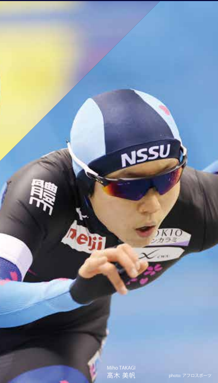
Miho TAKAGI 高木 美帆