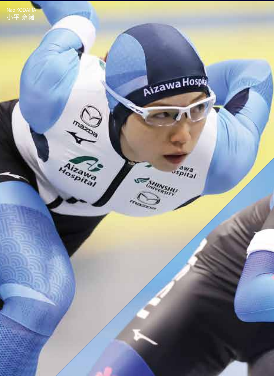
Nao KODAIRA 小平 奈緒